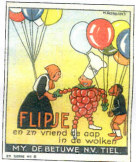
De IJsel drukte alles voor Tiels Flipje