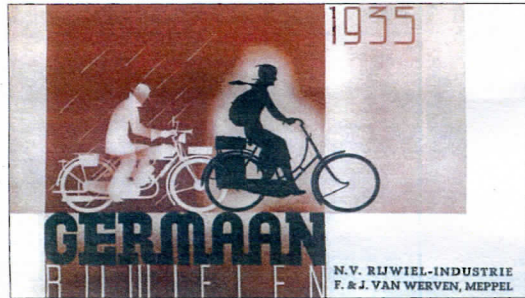
Folder voor Germaan rijwielen, 1935