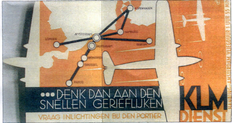
Folder voor de KLM

Smeele ontwierp bij De IJsel van alles en nog wat voor de klanten, van briefpapier tot brief-