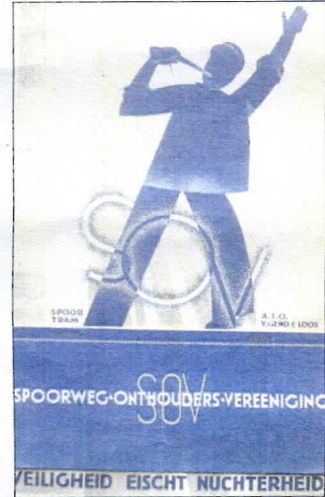
Ontwerp voor de Spoorweg Onthouders Vereniging