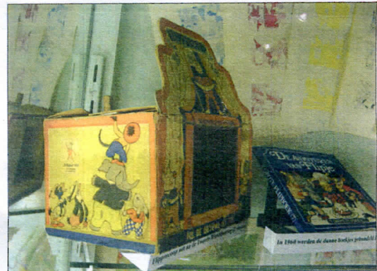
De Flipposcoop was een kartonnen theatertje waarin de strips van Flipje getoond konden worden