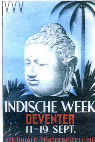
Omslag folder en affiche Indische Week Deventer, 1937