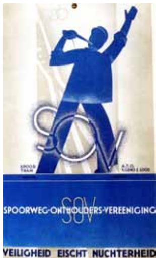
Afbeelding 46. Ontwerp voor de Spoorweg Onthouders Vereniging.

de jaren dertig. Smeele weet hier de natuurlijke kleur van het dikke bruine karton uit de Groningse strokartonfabriek grafisch te gebruiken.