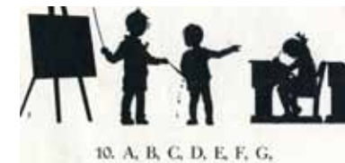
Afbeelding 45. Met silhouetten geïllustreerde liedbundel.

In deze ontwerpen komen ook modern vormgegeven typografische letters voor. Vermoedelijk zijn de letters van het woord 'Germaan' een eigen ontwerp. Dit had als groot voordeel dat De IJssel niet voor dit lettertype hoefde te betalen.