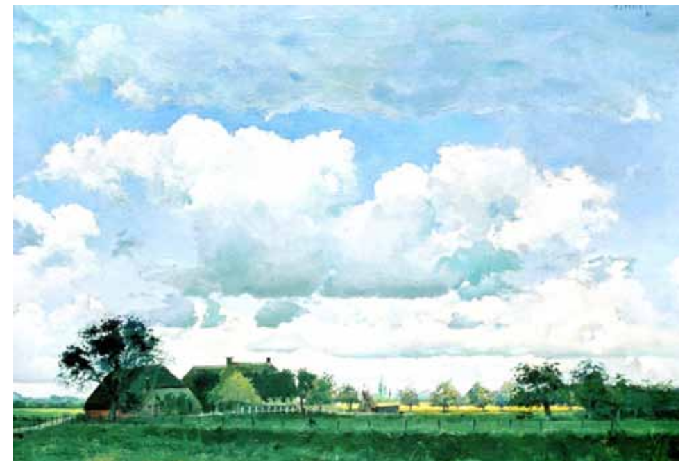
Afbeelding 54. Boerderij op De Wilpsche Klei, 1941.

In het voorjaar van 2011 wordt het werk dat Smeele naliert en voor het merendeel voor drukkerij De IJsel maakte, overgedragen aan Stadsarchief en Athenaeumbibliotheek. Ter gelegenheid van de overdracht van dit unieke materiaal zal SAB een tentoonstelling organiseren in zijn pand aan het Klooster 12.