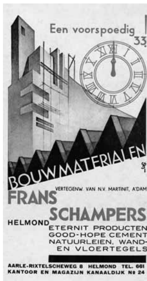
Afbeelding 4. Vroeg reclamewerk uit de Larense tijd.