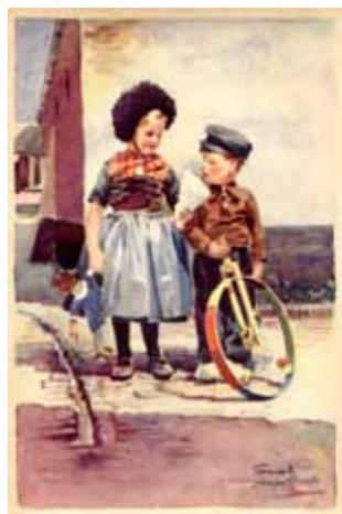
Afbeelding 21. Ansichtkaart 'Op de Veluwe' met aquarel van Smeele.