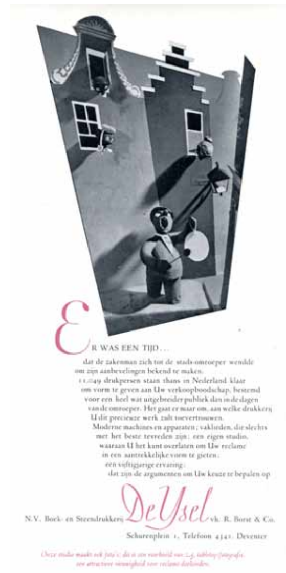
Afbeelding 49. Reclame met tabletop-fotografie.