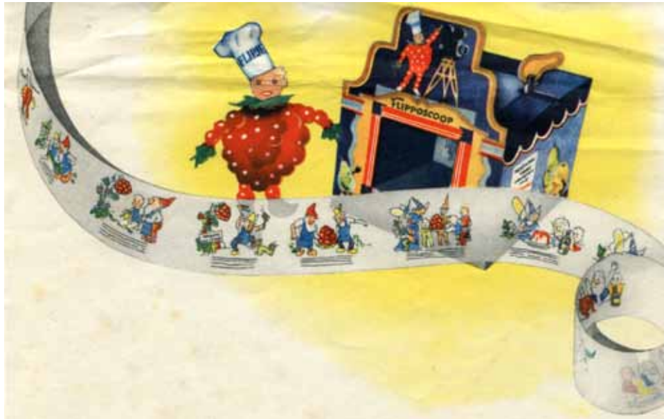
Afbeelding 51. De Flipposcoop.

chocoladeflikje, een ontwerp van Wiegman, maar dat in 1931 door Cassandre gemoderniseerd is. En natuurlijk kent ook iedereen nog Flipje van Tiel!