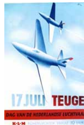
Afbeelding 15. Affiche vliegfeest vliegveld Teuge.

De affiches worden aan het eind van de negentiende eeuw als kunstobject populair door kunstenaars als Jules Chéret, Henri de Toulouse-Lautrec en Alphonse Mucha. Als in de