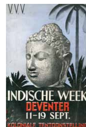
Afbeelding 20. Omslag folder en affiche Indische week Deventer, 1937.

loop van de jaren twintig de druktechnieken zo verbeteren dat drukkerijen in staat zijn om zulk groot drukwerk uit te voeren, wordt het affiche als reclameobject ook populair. De straat wordt expositieruimte en dat heeft tot gevolg dat grote steden als Amsterdam lijden onder het wildplakken. Men probeert het plakken van affiches te reguleren en zo verschijnen er in het stadsbeeld reclameborden en reclamezuilen.