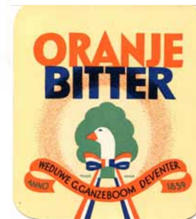
Afbeelding 50. Etiket Weduwe G. Ganzeboom Oranje Bitter met gansje.