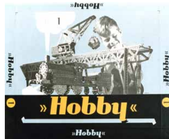
Afbeelding 30. Ontwerp doos voor constructiespeelgoed.

Zutphen ontwerpt hij in 1958 een aantal boekomslagen. Het betreft studieboeken die van een nieuw, fris omslag voorzien moeten worden.