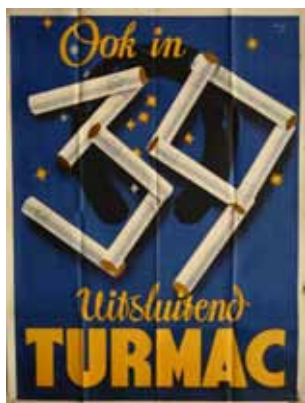
Afbeelding 14. Affiche Turmac, 1939.

Drukkerij De IJsel verzorgde zelf geen reclamecampagnes, maar maakte wel zo ongeveer alles wat uit zulke campagnes voortvloeide. Het was een veelzijdig bedrijf dat niet alleen verschillende druktechnieken in huis had, maar ook het werk kon verzorgen dat aan het drukken voorafging, zoals het maken van ontwerpen, of dat wat erop volgde, zoals stans- en kartonnagewerk.