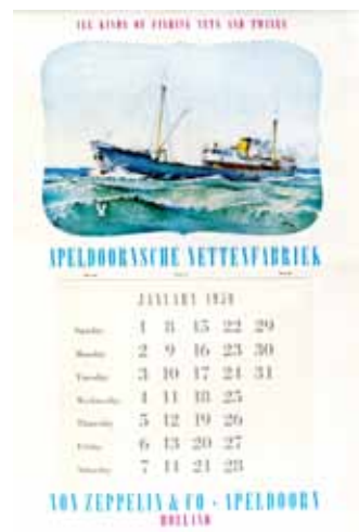
Afbeelding 25 (rechts). Kalender van 1950 voor de Apeldoornse Nettenfabriek.

een handjevol koffiebonen', vraagt Smeele aan zijn vrouw. Die bonen gebruikt hij vervolgens voor het affiche voor de AKET. Blijken de koffiekenner's vervolgens de bonen te herkennen als Douwe Egberts bonen! Een klein maar problematisch foutje.