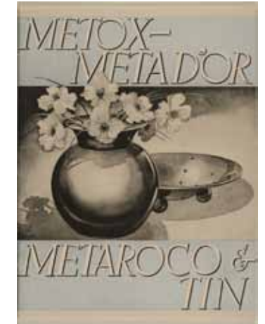
Afbeelding 53. Folder voor Metama.