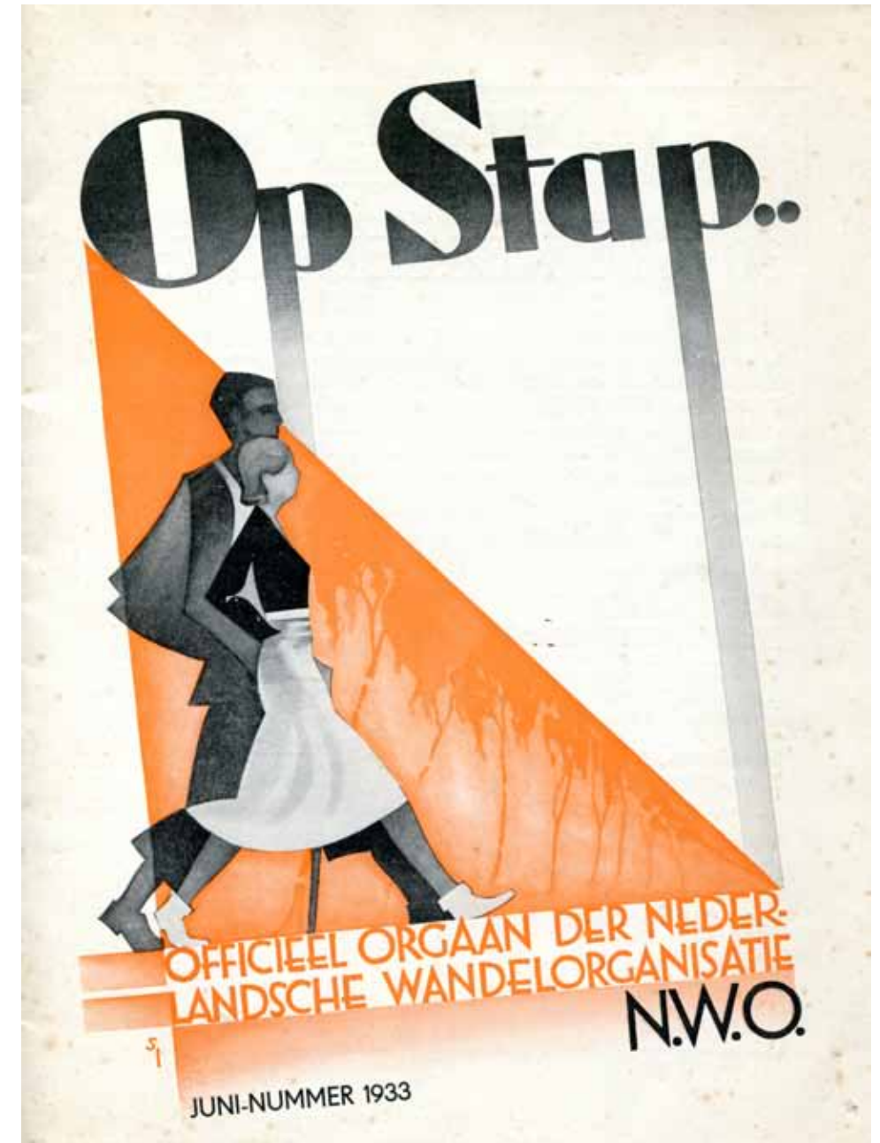
Afbeelding 37. Op stap, 1933.

De folder die Smeele maakt voor de Nederlandsche Wandelorganisatie (NWO) doet in het begin van de jaren dertig ook verrassend modern aan. Hij maakt gebruik van