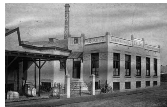
Afbeelding 8. De nieuwbouw aan de Hoge Hondstraat, begin jaren twintig.

IJsel zal gedurende zo'n twintig jaar de huisdrukker van uitgeverij Kluwer zijn. 9 Zo drukt De IJsel bijvoorbeeld in 1907 de gerenommeerde Kluwer-periodiek Vraag en Aanbod , of zoals dit weekblad ook wel bekendstaat: ? & !.