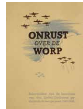
Afbeelding 17. Onrust over de Worp, 1945.