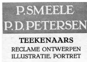
Afbeelding 3. Embleem Piet D. Petersen en Piet Smeele.