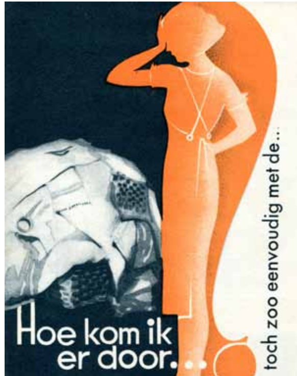
Afbeelding 38. Reclamefolder voor Velo-wasmachines.

diagonale lijnen en van letters die ook gedurfd schuin op het papier staan. De twee afgebeelde wandelaars zijn gestileerd weergegeven.