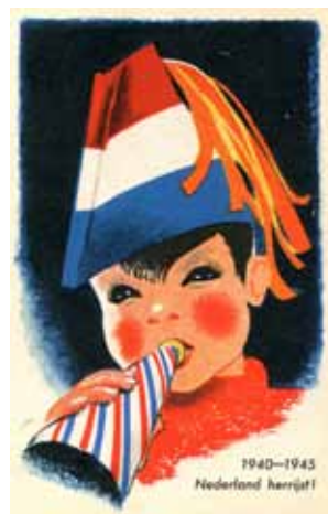
Afbeelding 22 en 23. Ansichtkaarten ter gelegenheid van de bevrijding, 1945.