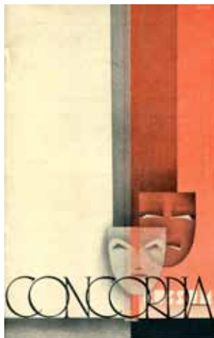
Afbeelding 36. Omslag reclamefolder voor Concordia in Bussum.

omdat al dat werk in opdracht uitgevoerd is, kenmerkt het werk zich door een bonte verscheidenheid van stijlen; van een wat suffige reeks ansichtkaarten over het leven rond de Zuiderzee – die overigens in enorme oplagen gedrukt is – tot series aquarellen van coasters voor kalenders van de Apeldoornse Nettenfabriek en tot affiches waarbij in verschillende stijlen gewerkt is.