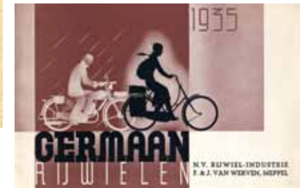
Afbeelding 41, 42 en 43. Omslagen van folders voor Feltext viltzeil, Balatum zeil en Germaan rijwielen, midden jaren dertig.