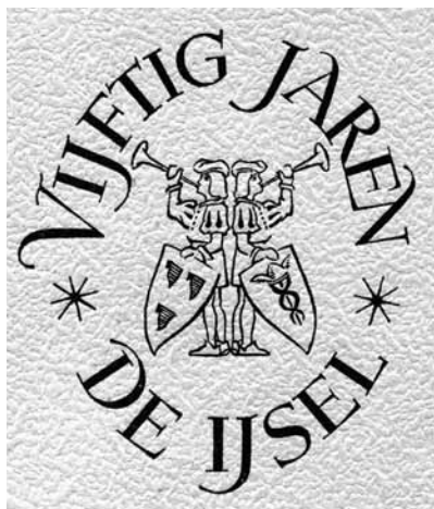
Afbeelding 9. Het vignet met de bazuinblazers, 1949 (ontwerp: P. Smeele).