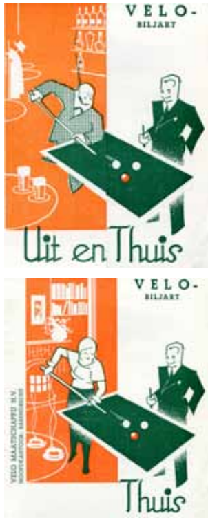
Afbeelding 34 en 35. Voorzijde en eerste pagina van een uitvouwbare folder voor biljarttafels van de firma Velo.