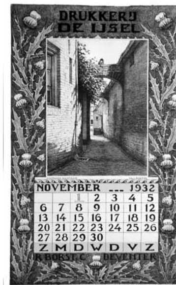
Afbeelding 11. Kalenderplaat van De IJsel, 1932, Paul Bodifée.

In de Tweede Wereldoorlog gaat een papieropslagplaats door brand verloren en een in 1939 aangeschafte nieuwe pers wordt door de bezetter weggehaald. De IJsel heeft in de oorlog uiteraard ook last van de papierschaarste en de stilvallende markt. Het bedrijf blijkt desondanks in staat om tijdens de oorlog te blijven produceren. Er worden in die tijd onder andere beeldaффiches voor de Duit-