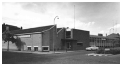
Afbeelding 10. De nieuwbouw aan de Hoge Hondstraat uit de jaren zestig.

makers gemaakt en ook stafkaarten voor het Duitse leger.