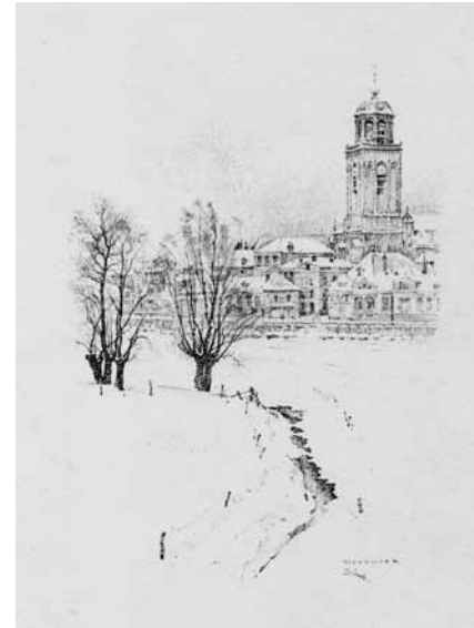
Afbeelding 5. Stadsgezicht van Deventer.

Er worden in de crisis- en oorlogstijd ook grote aantallen Ansichtkaarten geproduceerd, van foto's, tekeningen en aquarellen.