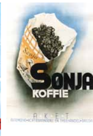
Afbeelding 16. Affiche voor Sonja koffie.