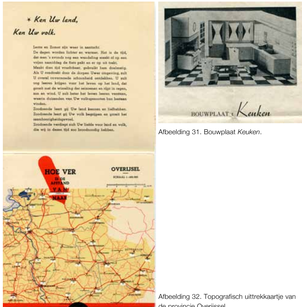
Afbeelding 31. Bouwplaat Keuken.