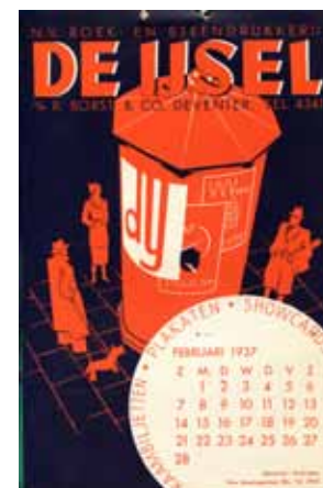
Afbeelding 26 en 27. Kalender van 1937 voor drukkerij De IJssel.

Als Smeele na ontslag genomen te hebben bij De IJssel als leerkracht gaat werken in Enschede en midden jaren vijftig in Zutphen, klust hij er nog aardig wat bij in zijn oude metier, het vormgeven van reclamemateriaal. Voor uitgeverij nv W.J. Thieme & cie in