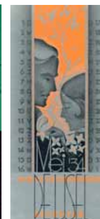
Afbeelding 28 en 29. Vloeiend blad voor De IJssel, 1934, met een reeds eerder gebruikte afbeelding met een sjabloon- en airbrushtechiek.