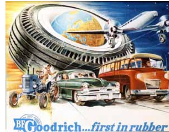
Afbeelding 52. Kalenderplaat voor BFGoodrich.

In het stijlvol afstemmen van kleurgebruik in het reclamemateriaal op het product was Smeele een meester, zoals te zien in de reclamefolder die hij maakte voor tinproducten van de firma nv Metama uit Tiel.