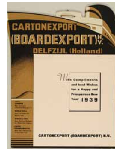
Afbeelding 44. Kalenderontwerp in de stijl van Cassandre.

Overigens werd bij De IJssel het verhaal verteld dat de KLM slecht van betalen was. Invloeden van het Bauhaus zijn bij Smeele ook terug te vinden in het gebruik van de kleuren zwart en rood in een reclameboekje dat hij maakte voor viltzeil voor de firma Feltext in Amsterdam. Een gestileerd getekende arbeider zien we in de weer met een grote rol zeil. Eenzelfde effect verkrijgt hij bij het ontwerp van een folder voor de firma Balatum uit Huizen. Voor de folder die hij in 1935 maakt voor Germaan rijwielen gebruikt hij dezelfde kleurstelling als voor Feltext.