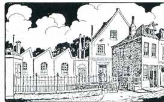
Afbeelding 7. Boek- en Steendrukkerij De IJsel, R. Borst & Co. aan de Molenstraat.

De doelstelling van de firma wordt breed geformuleerd: 'het drijven en exploiteeren van een drukkerij, het aankopen, verkopen en uitgeven van manuscripten, het drijven van