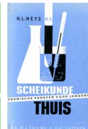
Afbeelding 18 en 19. Boekomslagen voor studieboeken van Thieme.