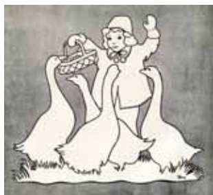
Afbeelding 47 en 48. Kleurplaat in de stijl van Rie Cramer.