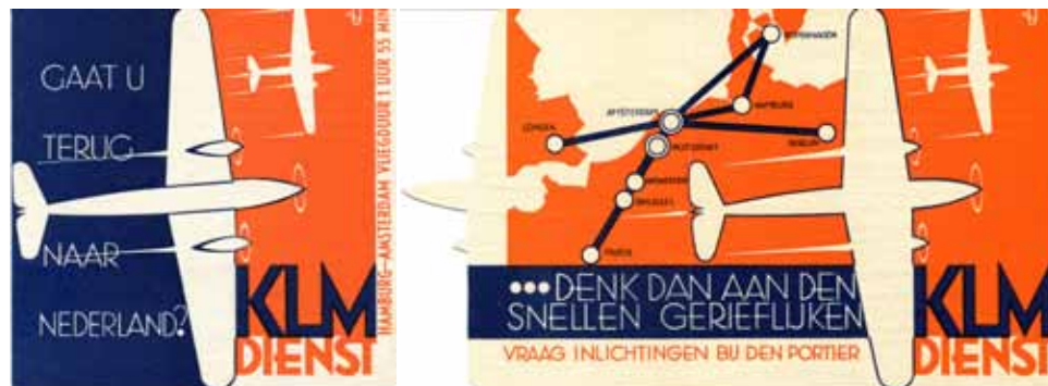
Afbeelding 39 en 40. Folder voor de KLM.

Het ingenieus afstemmen van het reclameontwerp op het stansen of afsnijden van het eenmaal gedrukte papier, zoals dat bij de folder voor de Velo-wasmachines gebeurd is, hanteert Smeele ook bij de vererende opdracht die De IJssel mag uitvoeren voor de KLM.