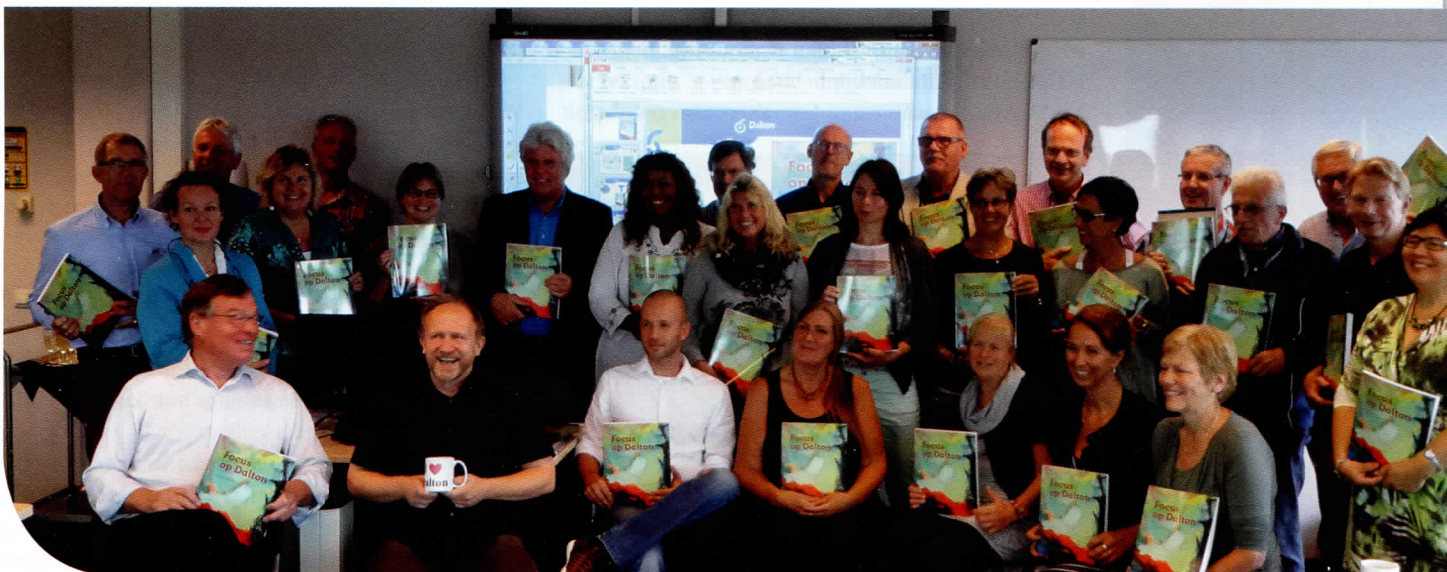
Presentatie van Focus op Dalton tijdens de scholing voor voorzitters van visitatiecommissies.