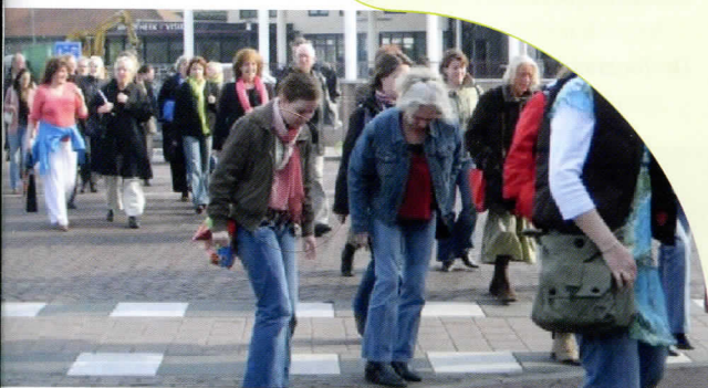
Daltonleraren op weg naar de opening van de daltonconferentie in de schouwburg in Deventer (2006).

Op 9 april 2014 zullen weer honderden daltonianen deelnemen aan het daltoncongres. Inmiddels is het een traditie om elkaar 's morgens in de schouwburg van Deventer te ontmoeten en daar een aantal centrale presentaties bij te wonen. 's Middags zijn er workshops in het gebouw van Saxion.