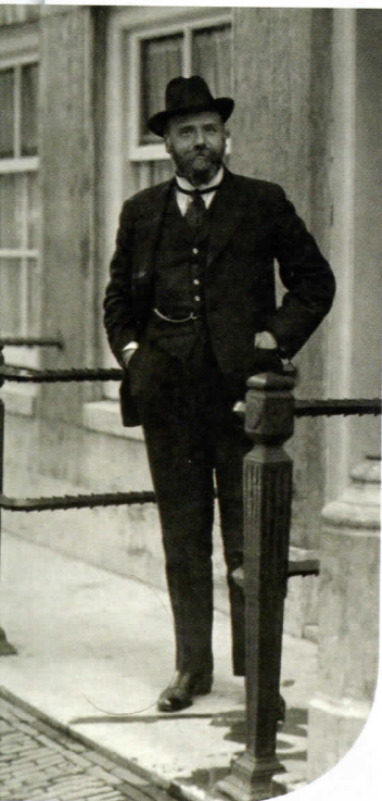
Prof. Philip Kohnstamm.

Daltonleraren streven ernaar om leerlingen op te voeden tot 'fearless human beings'. Deze breed geformuleerde onderwijsopbrengsten worden in het daltononderwijs wel aangeduid met persoonlijkheidsontwikkeling, een term die onder andere zijn oorsprong kent in de personalistische pedagogiek van Philip Kohnstamm, de eerste hoogleraar pedagogiek in Nederland. Maar terwijl het begrip persoonlijkheidsontwikkeling tegenwoordig omarmd wordt, kon Kohnstamm zelf de term niet gebruiken toen hij een concept ontwikkelde voor een toekomstige 'nieuwe school', dat geënt was op Parkhursts Dalton Plan.